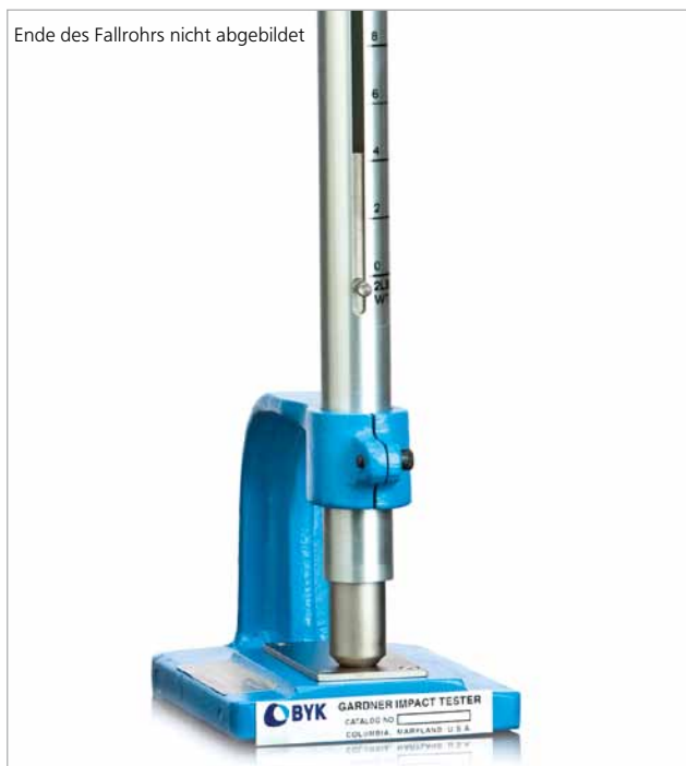
Kugelschlagprüfer leichte Ausführung

Beschreibung der Prüfmethode auf Seite 206